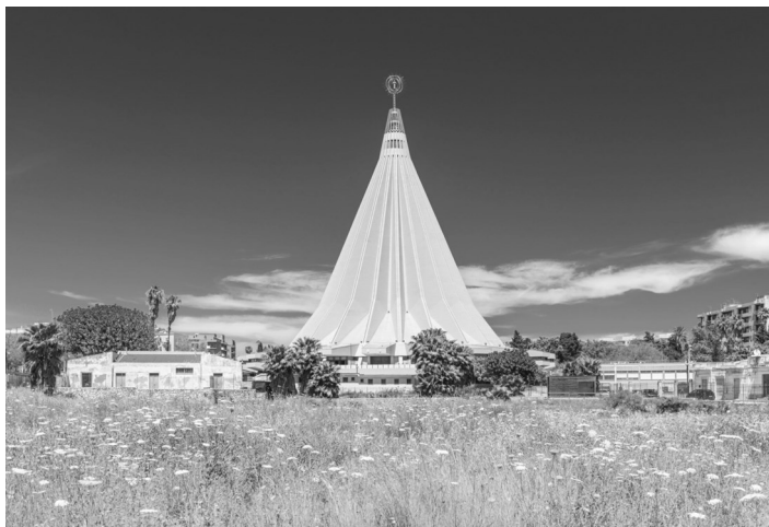
Sanktuarium Matki Bożej Płaczącej w Syrakuzach

KATANIA – SYRAKUZY – PALERMO – MONREALE – CEFALU ETNA – TAORMINA – WYPOCZYNEK NAD MORZEM – CAŁODNIOWA WYCIECZKA NA MALTE